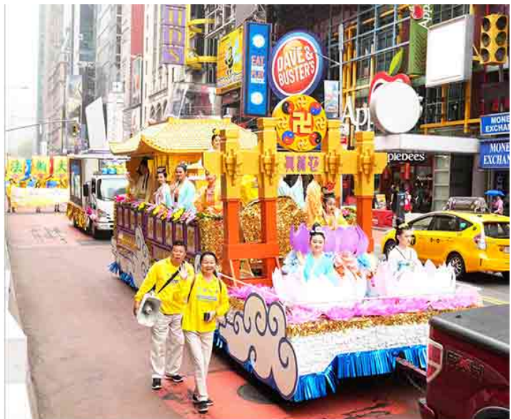
纽约曼哈顿盛大游行中的巨型花车 (封面是局部图)