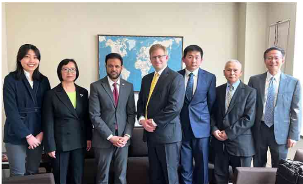
美国新任国际宗教自由大使拉沙德·侯赛因（左三）与法轮功学员合影。