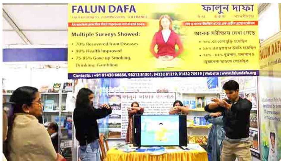
2020年2月印度加尔各答书博会，法轮功学员应邀参加并在期间演示功法。

他也努力翻译孟加拉语的《转法轮》和《法轮功》等书籍，希望更多人也能学炼法轮功，和他一样找到健康。