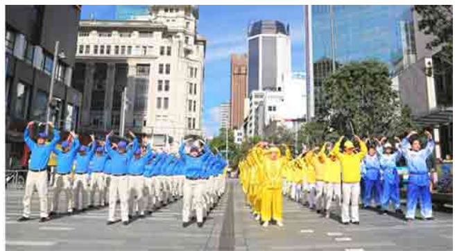
左图：在庆祝活动现场，法轮功学员腰鼓队进行表演。右图：法轮功学员集体炼功，场面祥和。