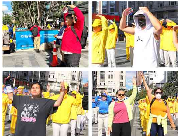
新西兰民众当场学炼法轮功。

五位法轮功学员及退党义工在集会上发表演讲。自1999年以来，中共对法轮功学员残酷迫害，甚至活摘他们的器官牟利，并发展成一个巨大的产业链。