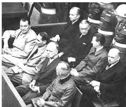
当年纽伦堡审判期间，坐在被告席上的纳粹被告。

23年前，在中国大陆，一个类似文革时期的“文革小组”和纳粹德国的盖世太保机构——“610办公室”设立。